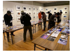
大写真展審査会の様子

現在企画委員は総勢27名。長年企画委員として協力してくださる方も多く、中には今年で18年目という方も！ 普段はそれぞれのお仕事をされており、さまざまな目線からの意見が出ます。